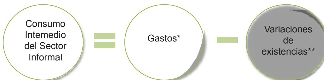
Diagrama 2. Consumo Intermedio del Sector Informal

* Gastos para la compra de materias primas, suministros y servicios utilizados como inputs intermedios.