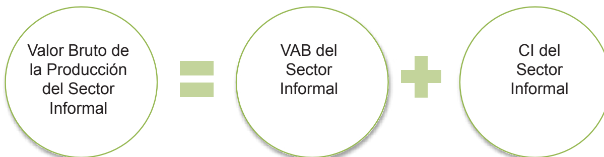
Diagrama 3. Valor Bruto de la Producción del Sector Informal

Por lo que una vez calculado el VAB SI y el CI SI, se adicionan para obtener el VBP SI: