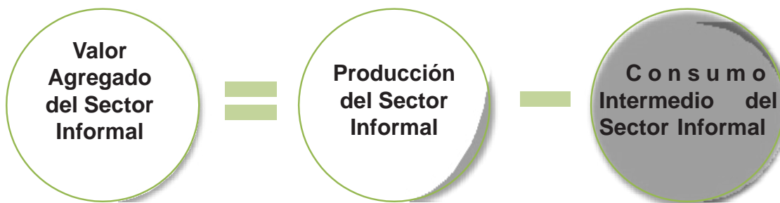
Diagrama 1. Valor Agregado del Sector Informal