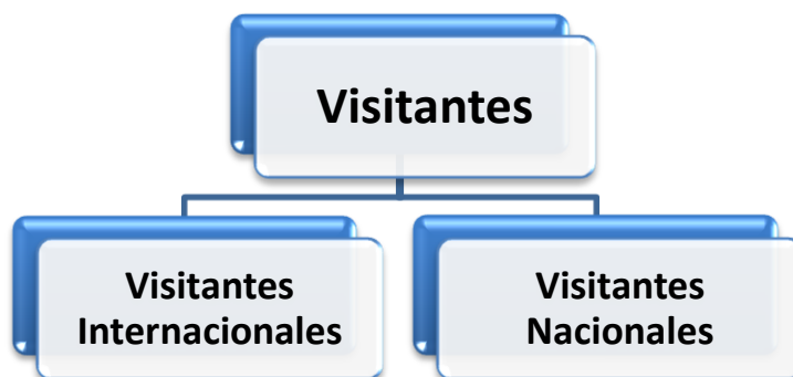
Diagrama 2: Clasificación de los visitantes

Ambos tipos de visitantes, tanto internacionales como nacionales, contemplan a las personas que pernoctan, y a las que se consideran visitantes de un día (excursionistas).