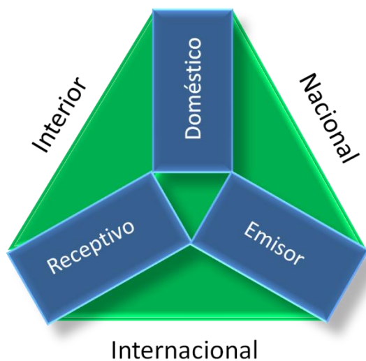
Diagrama 3: Formas y tipos de turismo