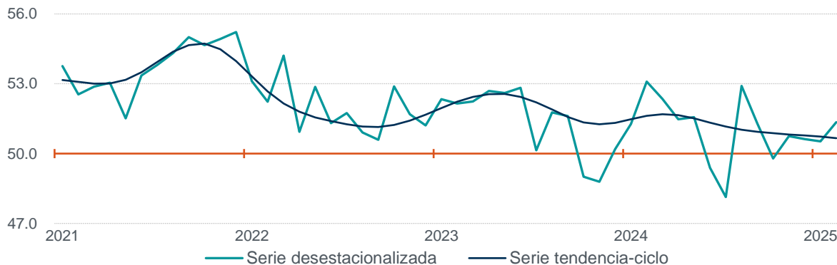
Gráfica 1 Serie desestacionalizada y de tendencia-ciclo del Indicador de Pedidos Manufactureros enero de 2021 a febrero de 2025 (puntos)

Nota: Series elaboradas mediante métodos econométricos. Fuente: INEGI y Banco de México. Encuesta Mensual de Opinión Empresarial (EMOE), 2025.