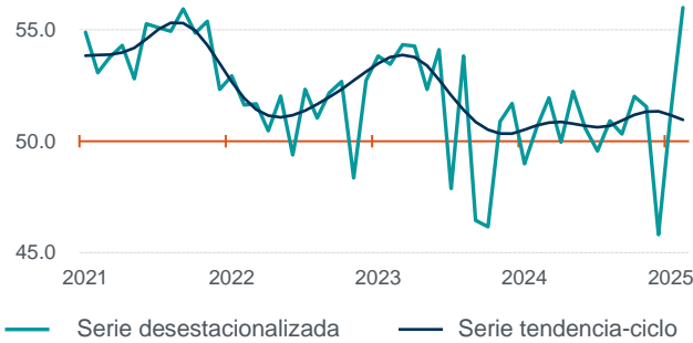
Inventarios de insumos

Nota: Series elaboradas mediante métodos econométricos. Fuente: INEGI y Banco de México. Encuesta Mensual de Opinión Empresarial (EMOE), 2025.