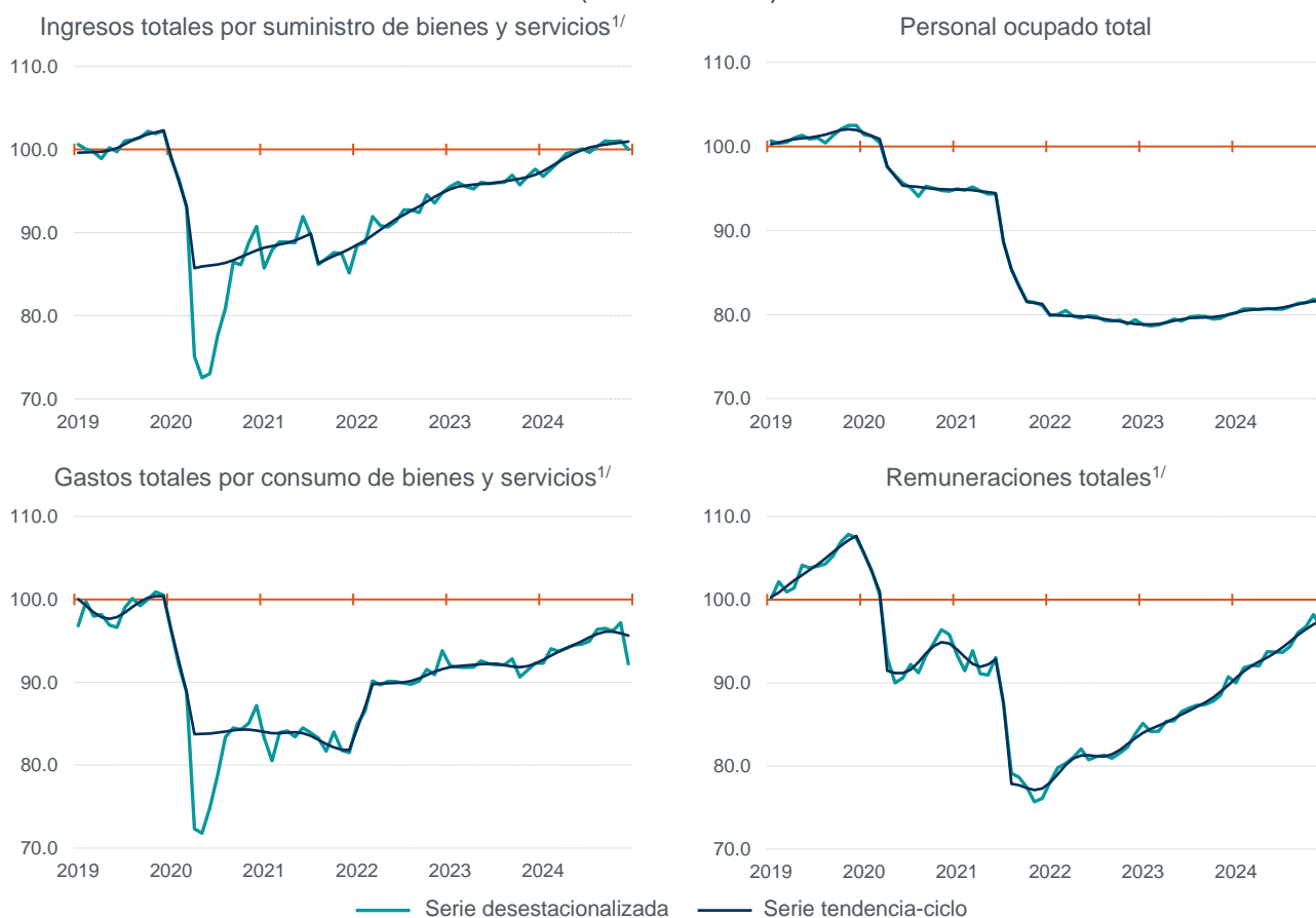
Gráfica 2 Serie desestacionalizada y de tendencia-ciclo de los indicadores del sector servicios enero de 2019 a diciembre de 2024 (índice 2018=100)

Nota: Series elaboradas mediante métodos econométricos.